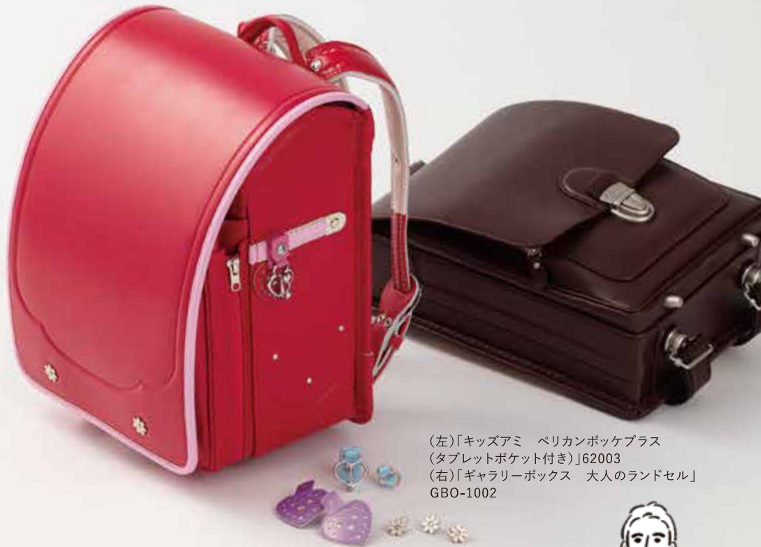
(左)「キッズアミ ペリカンポッケプラス (タブレットポケット付き)」62003 (右)「ギャラリーボックス 大人のランドセル」 GBO-1002