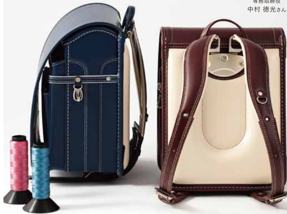
(右)牛革ボルサ パステルクラシック 茶 (左)牛革ボルサ パステルクラシック インディゴブルー